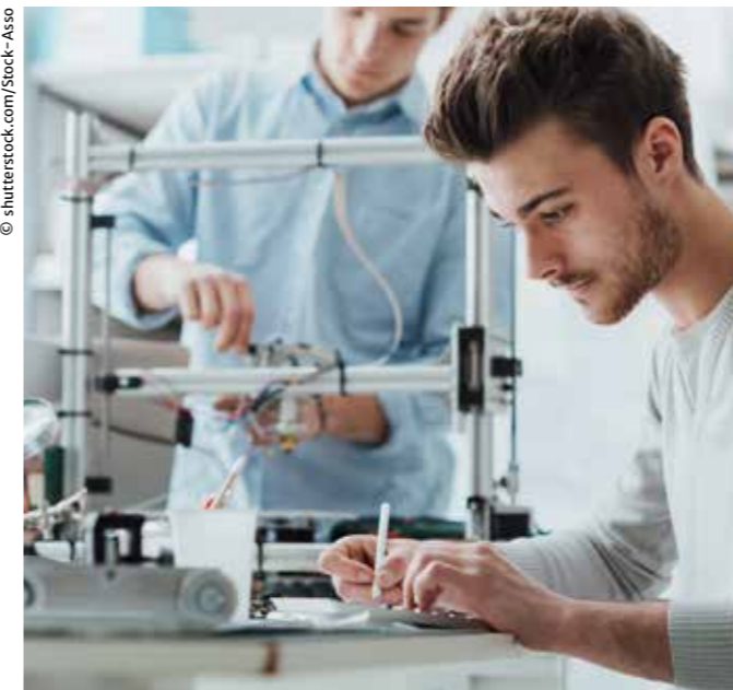
Digitalisierung und Innovation sorgen für sicheres Wachstum.