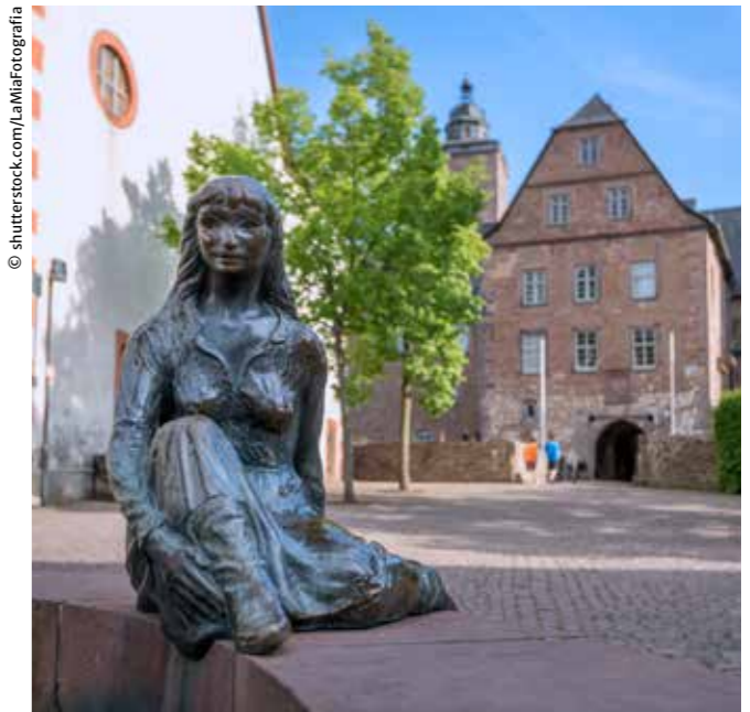
Märchenhafte Städtchen sorgen für eine hohe Lebensqualität.